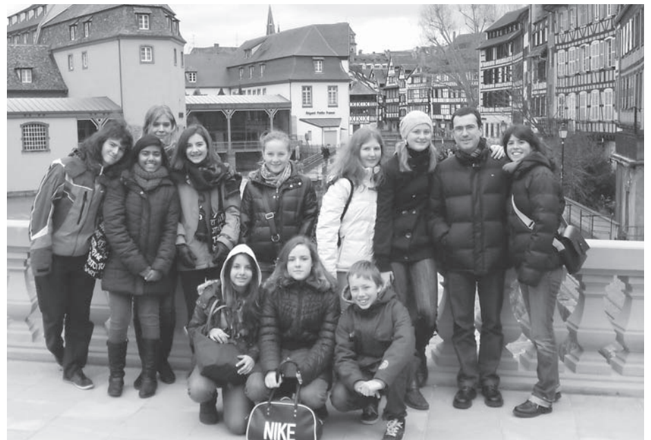
Die Hermes-Gruppe in Strasbourg

Wir sind alle bereichert und beschenkt nach Hause gekommen und machen uns nun zusammen auf den Weg – auf dass unsere Minischar mit guten NachwuchsleiterInnen in eine gute Zukunft gehe! M. Anders